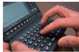
Légende accompagnant l'illustration.

bortis nisl ut aliquip ex en commodo consequat. Duis te feugifacilisi per suscipit lobortis nisl ut aliquip ex en commodo consequat.