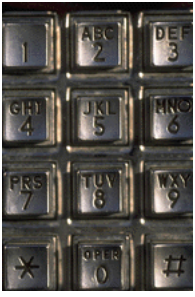
Légende accompagnant l'illustration.

Les informations les plus importantes se trouvent ici, à l'intérieur de la brochure. Présentez votre organisation ainsi que les produits ou services spécifiques qu'elle propose. Ce texte doit être court, et donner envie au lecteur d'en savoir plus.