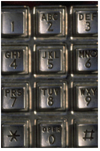
Légende accompagnant l'illustration.

Les informations les plus importantes se trouvent ici, à l'intérieur de la brochure. Présentez votre organisation ainsi que les produits ou services spécifiques qu'elle propose. Ce texte doit être court, et donner envie au lecteur d'en savoir plus.